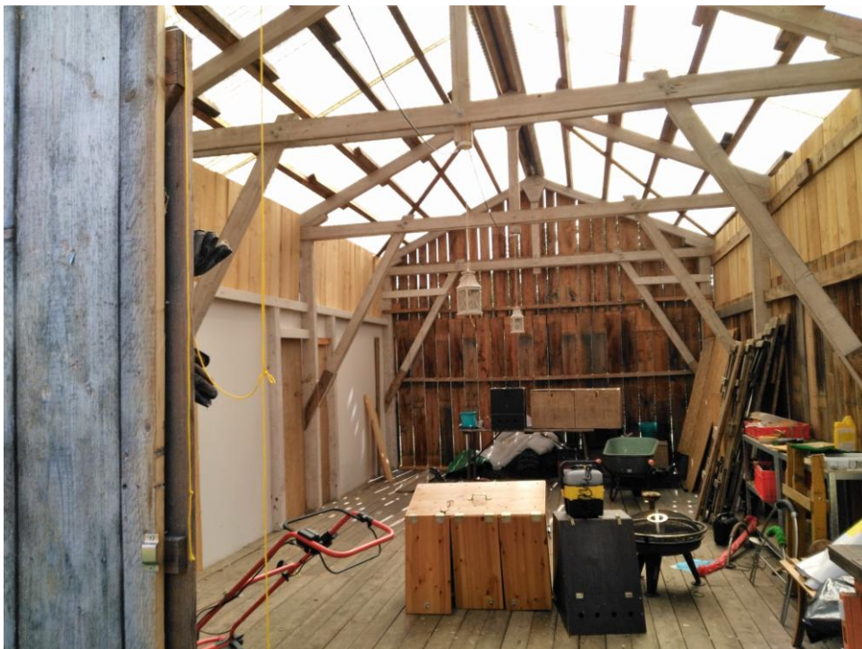
Innenansicht des Schopfes